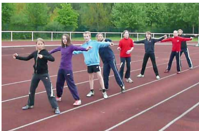
Leichtathleten im Training

Im Leichtathletikverband startet er ab diesem Jahr für das Sportinternat Bad Soden- Allendorf, im Turnverband weiterhin für den TV Idstein.