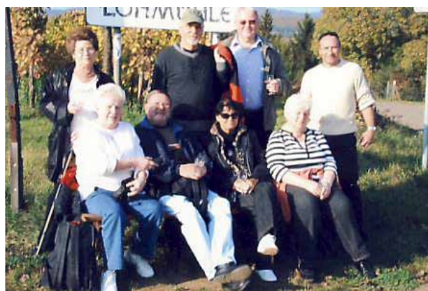
Fahrt der AH in den Rheingau