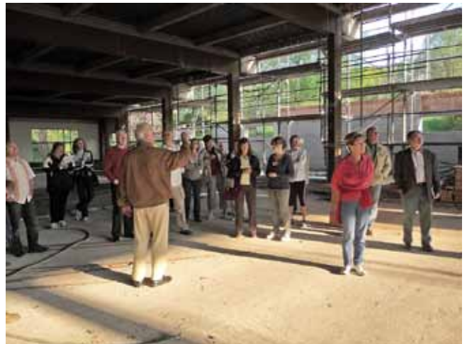
Besichtigung der Baustelle durch den erweiterten Vorstand