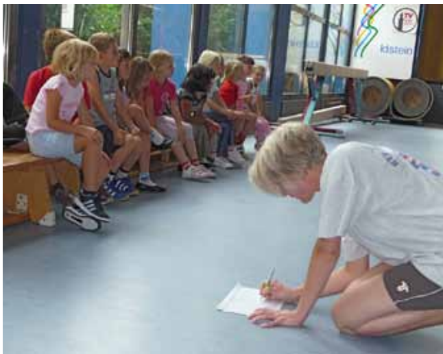
1. und 2. Schuljahr

Die erste Ausgabe unserer Vereinszeitung in diesem Jahr möchte ich dazu nutzen, noch einmal an unsere tolle Weihnachtsfeier zu erinnern und mich bei allen Beteiligten, Helfern, Zuschauern, Kuchenbäckern, allen auftretenden Kindern und allen Übungsleitern zu bedanken.