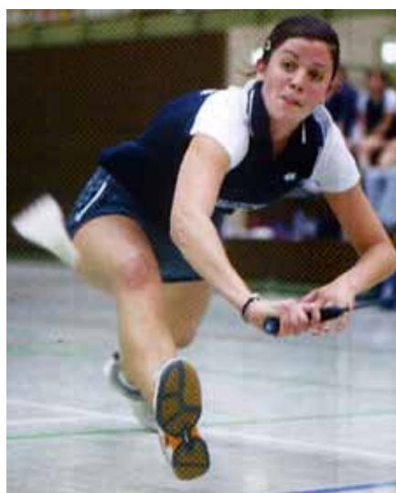
Immer den Ball im Fokus!